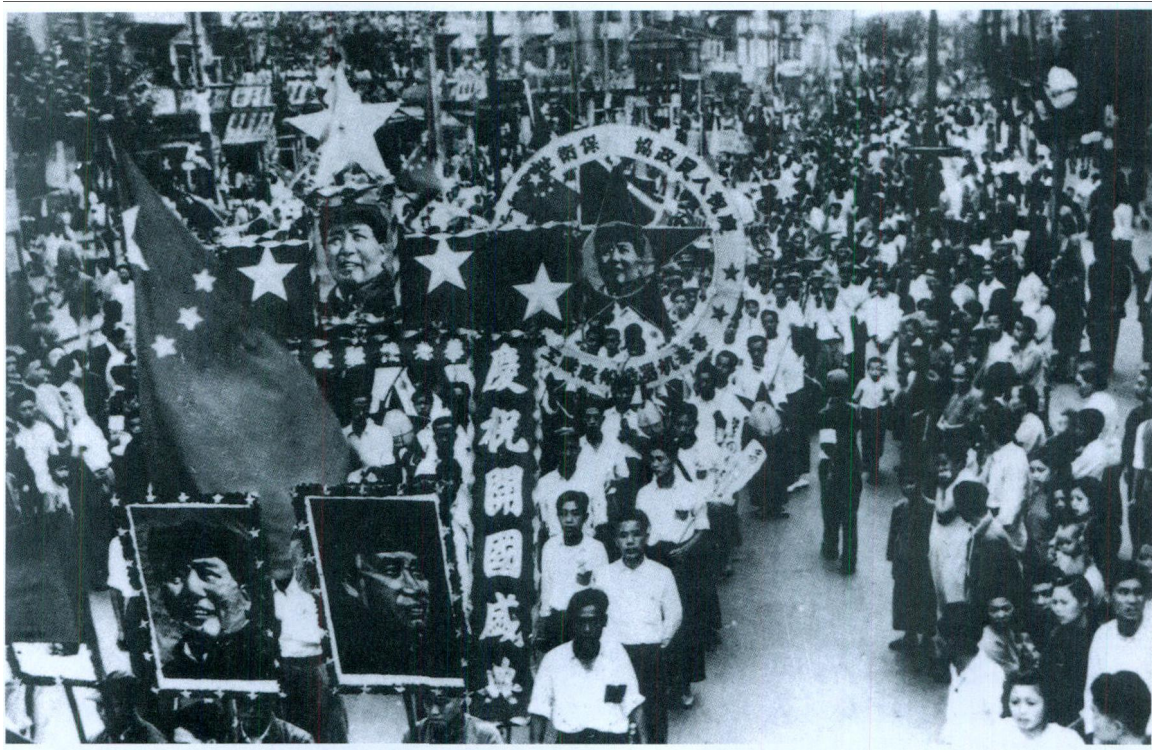
>>1949年10月1日，上海市百万群众游行庆祝新中国的诞生。

《英国外交文件集》中记载了英国外交大臣贝文看到此信后的矛盾心理。所谓唇亡齿寒，一方面贝文认为英国政府不应对美、法等国兵营被征用坐视不管；另一方面，他又不愿与美国口信中“强硬的气”搅在一起。于是，他指示高来含，要让中国政府相信，在此事中英国只是传话而已。