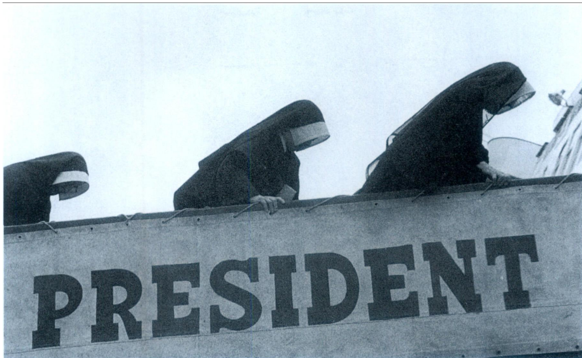
>>1949年上海解放前，外侨又一次大撤退。天主教神职人员（包括图中正在登轮的修女），纷纷离沪。解放军接管时，上海还有26683名外国人。